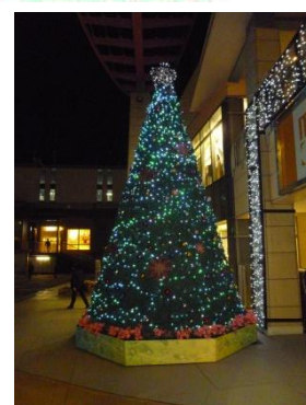
海浜幕張駅前広場にて

いい事も悪いことも多い忙しい季節ですが、あまり無理をなさらずに、楽しく元気よく今年最後の月をお過ごしください。