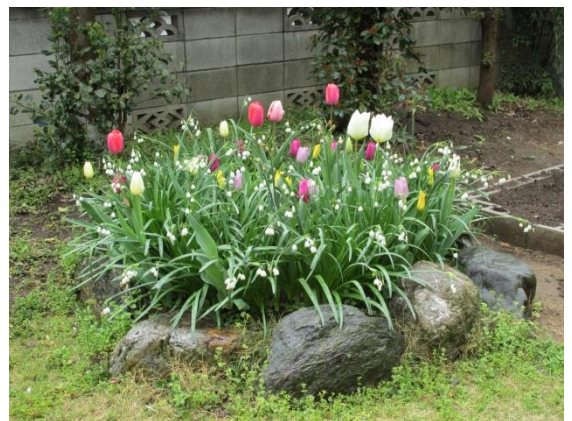
2015 年 4 月 11 日 地域の茶の間庭にて